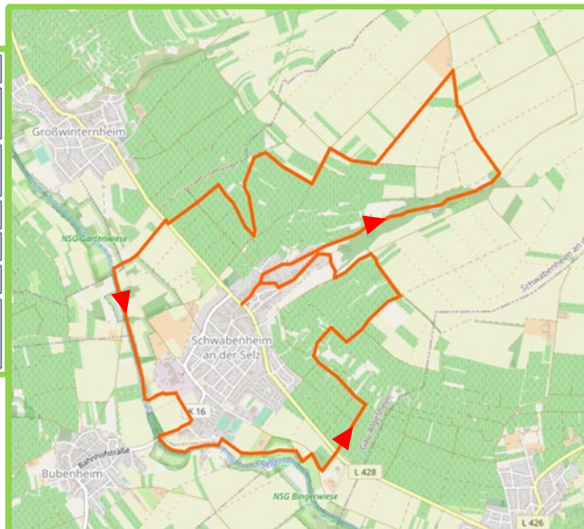
Karte von OpenStreetMap, Lizenz CC-BY-SA